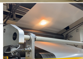
NIR sensors in an industrial laminating machine (right); precise detection of resin application (left) despite slight roller misalignment