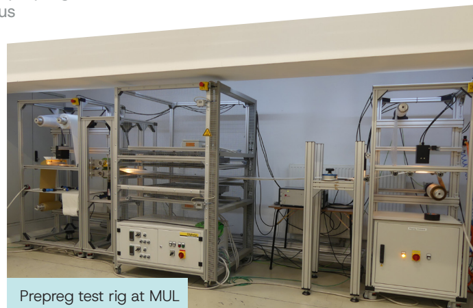
Prepreg test rig at MUL

were implemented in an industrial environment, at a hotmelt lamination line of Isovolta AG. There, quantitative data of the resin film thickness was successfully acquired on a number of different laminates. ▲