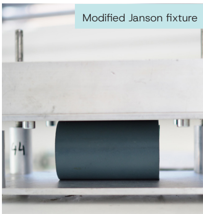
Modified Janson fixture

A new method is being developed for faster lifetime estimation of unpressurised pipes, combining numerical analysis and experimental tests. First, the load and deformation state of buried unpressurised pipes is described using finite element analysis (FEA). Key material properties such as failure times and relaxation moduli are determined using modified Janson and 3-point bending tests (3PB). Based on these results, a fracture-mechanical model to describe crack growth in unpressurised pipes is developed and experimentally validated using the Janson test. ▲